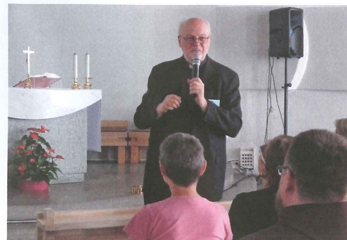
"Vardagsmystik - att leva sitt liv med Kristus". Sankt Ansgars kyrkorum ramade in en workshop med biskop Anders. Hans utgångspunkt var att försöka leva varje stund i Jesu närvaro och till hans ära.